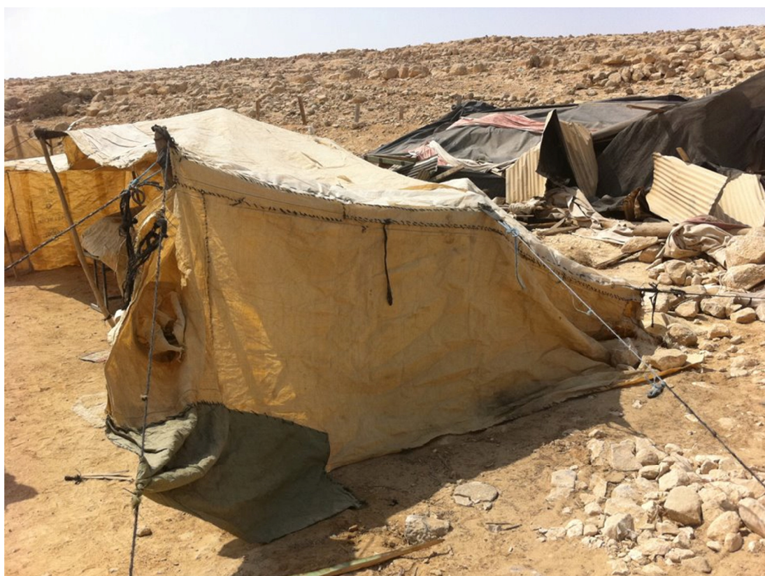
תמונה 3: מגורים זמניים של תושבים שבינם נהרס בוודי אריכא, 20.9.12