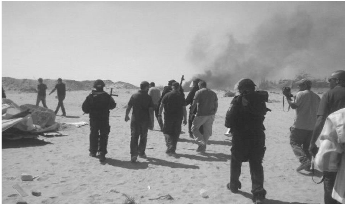
תמונה 6: שוטרים במהלך המהומות בביר הדאג' 12.11.12

השוטרים עצרו אותי בבוקר ורק בשעות הערב הובהלתי לבית החולים סורוקה, על אף שהייתי פצוע ודממתי משעות הבוקר. בבית החולים סורוקה סירבו להעניק לי טיפול רפואי בטענה שצריך את הסכמתם של אחד מהוריי. ביקשתי מהשוטרים להשיב אליי את הטלפון הנייד שלי בשביל להתקשר הביתה ולומר להורי שיבואו אליי לבית החולים, אבל השוטרים מנעו זאת ממני.