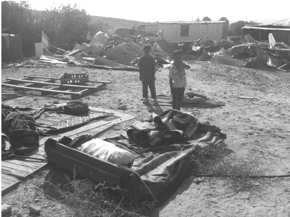
תמונה 7: ילדים על הריסות ביתם, רחמה 30.8.12

אני המום עד מאוד מההתנהגות של השוטרים שאמורים לשמור על בטחוני, לא יודע מה עשיתי שהם יתנהגו ככה. אני אזרח במדינה הזאת ויש לי זכויות של קטין. למה הם עשו את זה?"