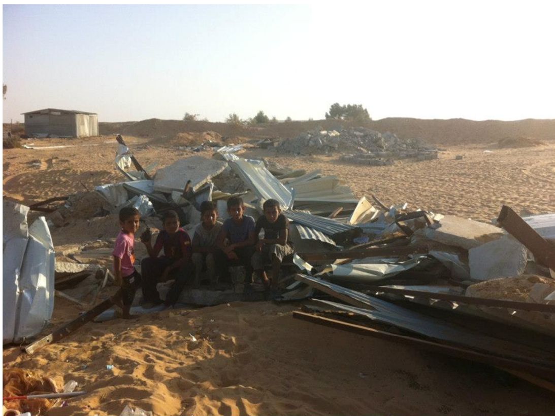
תמונה 4: ילדים על הריסות ביתם בביר הדאג', 27.9.12