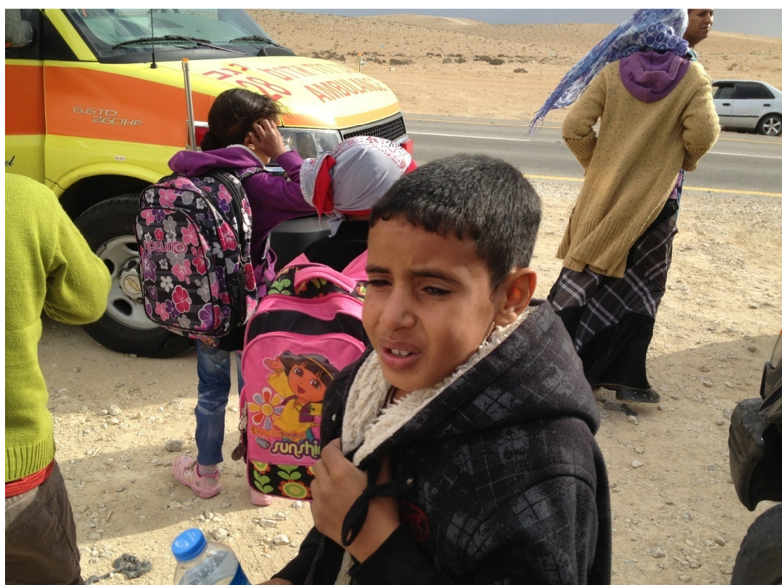
תמונה 5: ילדים שנפגעו מגז מדמיע בביר הדאג' הובהלו לבית החולים סורוקה, 12.11.12