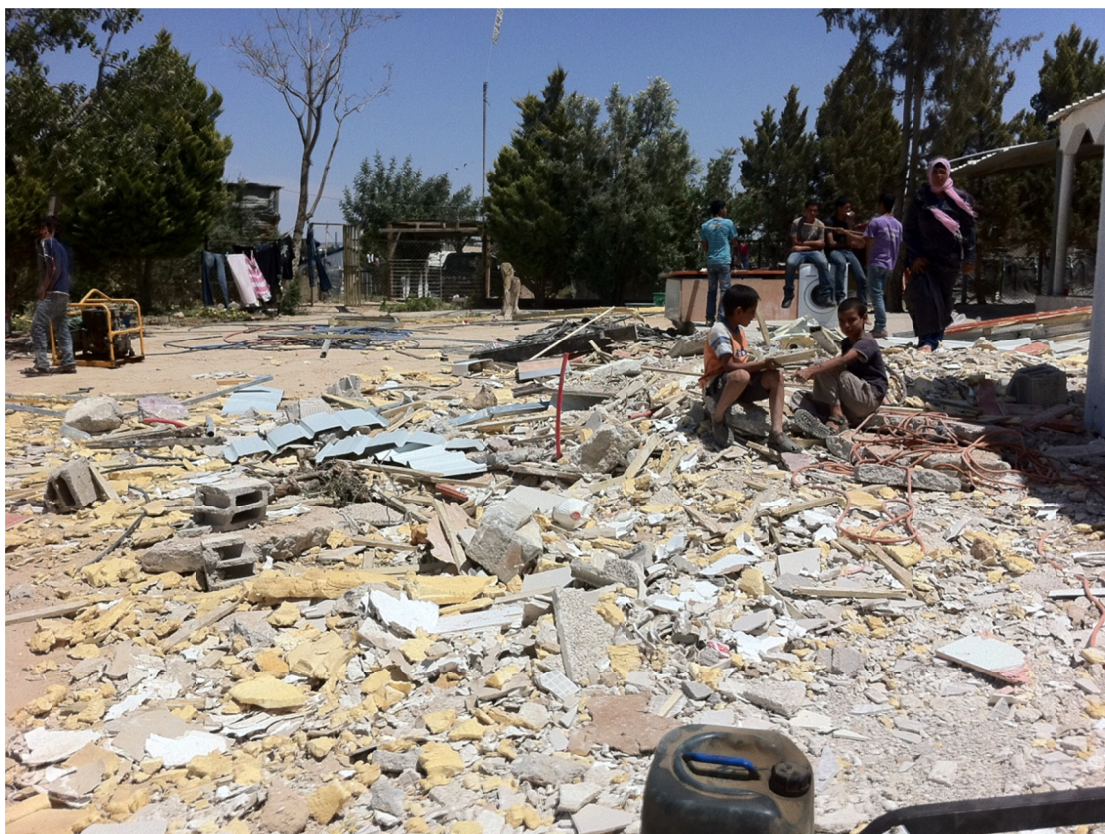
תמונה 2: חורבות הבית של משפחת אמנה אלזיאדנה בח'רבת אל-באטל 2.5.12