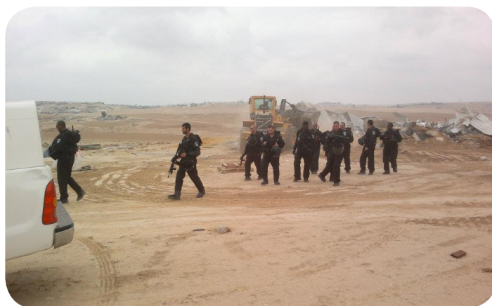
תמונות 10 עד 12: בית מזרחית לחורה טרם הריסה, במהלך ההריסה ולאחריה, 21.1.12