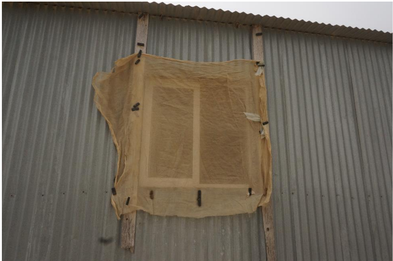
חלון מכוסה רשת.

ביום הבינלאומי לזכויות אדם ראוי שממשלת ישראל ורשויותיה השונות יבחנו מחדש את יחסן אל הקהילה הבדואית בנגב. במקום להגן על זכויותיהם של חברי וחברות הקהילה הבדואית, פועלות רשויות השלטון להפרת זכויותיהם באופן עקבי ובלתי פוסק. אין ספק כי הבטחת זכויותיהם של כלל תושבי הנגב, אספקת שירותים ותשתיות איכותיות לכלל היישובים ופיתוח שמתמקד בקהילות שאכן זקוקות לו, יצמצמו את אי השוויון העמוק בין הקהילה היהודית והקהילה הבדואית באזור ויתרמו לנגב בר קיימא לטובת כל תושביו.