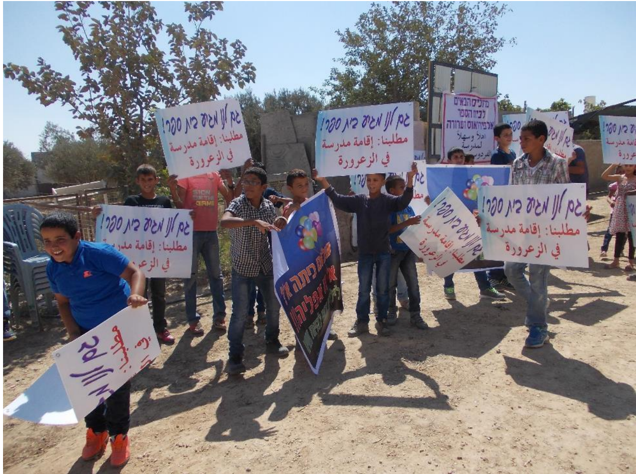
ילדי הכפר אַז-זַערוּחָה שובתים ב-1 בספטמבר 2015, היום הראשון ללימודים, ומפגינים בדרישה לפתוח בית ספר בכפרם.

בפועל, אין ספק כי עלות הסעת התלמידים מדי שנה (תקציב ההסעות בשנת 2009 עמד על 72 מיליון ש"ח 24 ) עולה על עלות הקמתם של בתי ספר בכפרים הבלתי מוכרים בנגב. עם זאת, הסיבה לסירוב המדינה לפתוח בתי ספר בכפרים אלה נעוצה כאמור בסירובה של המדינה להכיר בכפרים אלה ובתוכניותיה השונות להעביר את תושביהם אל העיירות הבדואיות המתוכננות. כך, במסגרת מאבקה של המדינה נגד הכפרים הבלתי מוכרים בנגב, היא פונעת פגיעה קשה בזכותם לחינוך של הילדים והנערים הבדואים בנגב.