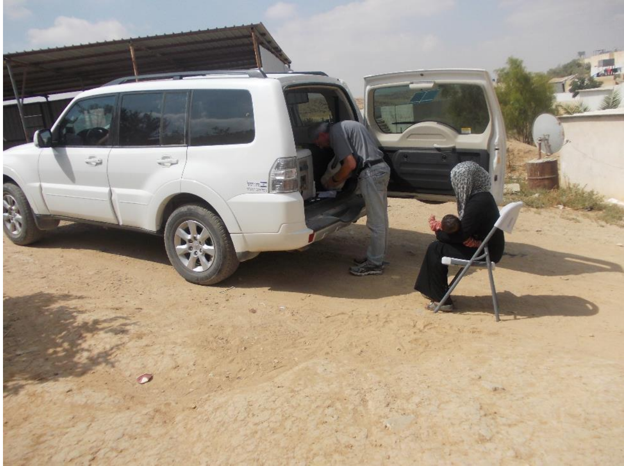
התחנה הניידת לבריאות המשפחה שפעולתה הופסקה בכפר עתיר.

בפועל, ולמרות המלצות מבקר המדינה, לא חל שינוי משמעותי במהלך חמש השנים שחלפו מאז פרסום דו"ח המבקר לשנת 2010. כפי שדיווח המבקר, עדיין פועלות בכפרים המוכרים החדשים שש תחנות בלבד. בכפרים הבלתי מוכרים, פועלת רק תחנה אחת מתוך שתיים עליהן דיווח המבקר. על אף שעל פי חוק ביטוח בריאות ממלכתי (תשנ"ד-1994) כל תושב זכאי לשירותי בריאות, ומשרד הבריאות הוא האחראי למתן השירותים הללו הכוללים גם תחנות לבריאות המשפחה, ועל אף שיעור תמותת התינוקות הגבוה בקרב האוכלוסייה הבדואית, שירותים אלה אינם זמינים ונגישים בצורה מספקת ובמרחק סביר למרבית האזרחים הבדואים המתגוררים בכפרים המוכרים והבלתי מוכרים.