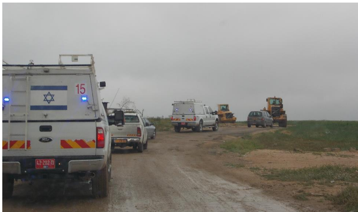
שיירת ניידות משטרה ובולדוזרים במבצע הריסת בתים בכפר הבלתי מוכר אַז-זַעְרֻרָה.

מדיניות הריסת הבתים המופעלת על ידי המדינה נגד הקהילה הבדואית נתפסת לרוב כהריסה של בתים בידי המדינה, בה מגיעים דחפורים מלוויים בשוטרים והורסים את המבנים המיועדים להריסה. בפועל, הרוב המוחלט של ההריסות בשנים האחרונות יוצאות לפועל על ידי בעלי הבתים עצמם. ישנן מספר סיבות להעדפה של יותר ויותר אזרחים בדואים להרוס את בתיהם בעצמם. האחת, היא הרצון לחסוך מבני משפחותיהם את החוויה הטראומטית של הגעת כוחות משטרה גדולים מלוויים בבולדוזרים להרוס את ביתם. השנייה, האפשרות לבצע הריסה מבוקרת בשעה ידועה מראש תוך הוצאת כלל הציוד מתוך הבית והצלת מרבית חומרי הבנייה. הסיבה השלישית, זו שעומדת במרכז פרק זה, היא האיומים הגוברים מצד פקחי הרשויות השונות בהשתת עלויות ההריסה על בעלי הבית במידה ולא יהרסו את ביתם בעצמם.