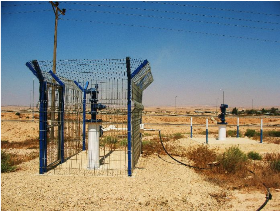
נקודת מים, על ציר 25, סמוך לכפר הבלתי-מוכר ח'אשם זאנה. נקודות המים פרוסות על צירי התנועה הראשיים בנגב.

אורך הצינורת המחברים את נקודות המים לבתי הכפר נע ממאות מטרים ועד למספר קילומטרים על פי מרחק הכפר מציר התחבורה ומנקודת המים. פריסת התשתית היא באחריותם ובמימונם המלא של התושבים. החיבור מתבצע על ידי פריסת צינור פלסטיק מנקודת המים אל בתי הכפר, כאשר עלות החומרים, זמן העבודה הדרוש להתקנה והתחזוקה השוטפת הינם באחריות התושבים.