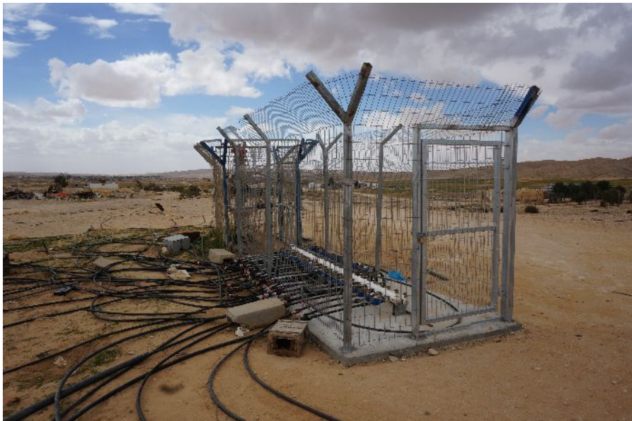
נקודת מים בכפר הבלתי-מוכר רח'מה. תושבי הכפרים הבדואים משלמים את מחיר המים הגבוה ביותר בישראל בעבור צריכה ביתית.

אם כך, כבר מנקודת הפתיחה הכפרים הבלתי-מוכרים משלמים את תעריף המים הגבוה ביותר בישראל. אולם, תעריף המים אינו התחנה האחרונה. לכך יש להוסיף את הוצאות הנחת תשתית הצנרת, מחיר הטיפול בשפכים המוטל על התושבים ואת מאות הקו"בים הנוספים הנמדדים בשעון מקורות ביחס לשעונים שמתקינים אנשי הכפרים. כלל ההוצאות הללו מעלות את מחיר המים הסופי והופכות אותו גבוה באופן משמעותי מהמחירים אותם משלמים אזרחי ישראל בעבור שימוש ביתי במים.