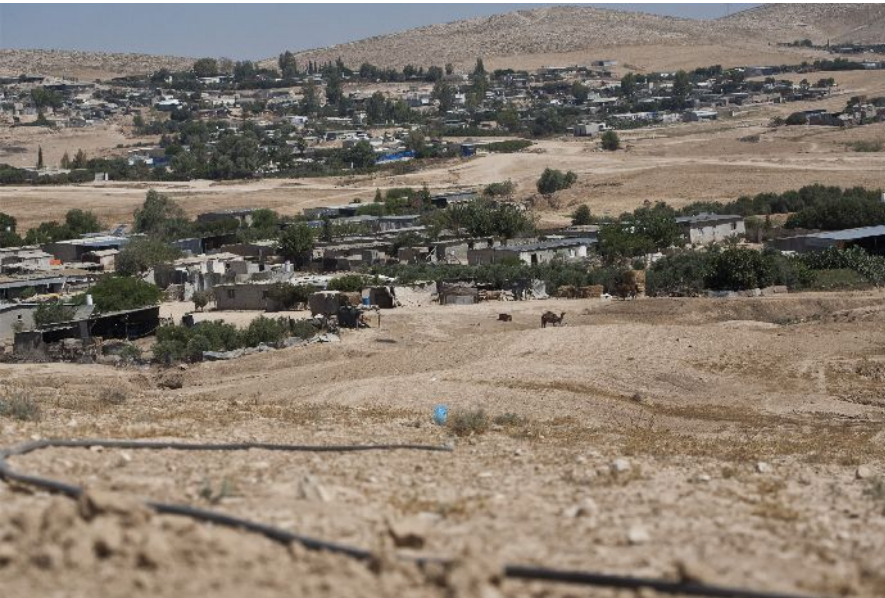
צינור מים הנפרס כל הדרך אל הכפר הבלתי-מוכר אלמקימאן.

כך קורה שההוצאה הכוללת על צריכת המים בכפרים היא גבוהה מאד ומהווה נדבך מרכזי בהוצאות המשפחה. בהתחשב בעובדה שתושבי הכפרים הבלתי-מוכרים שרויים לרוב במצב כלכלי קשה, הרי שמחיר המים המופקע יוצר מחסום ממשי לנגישות למים.