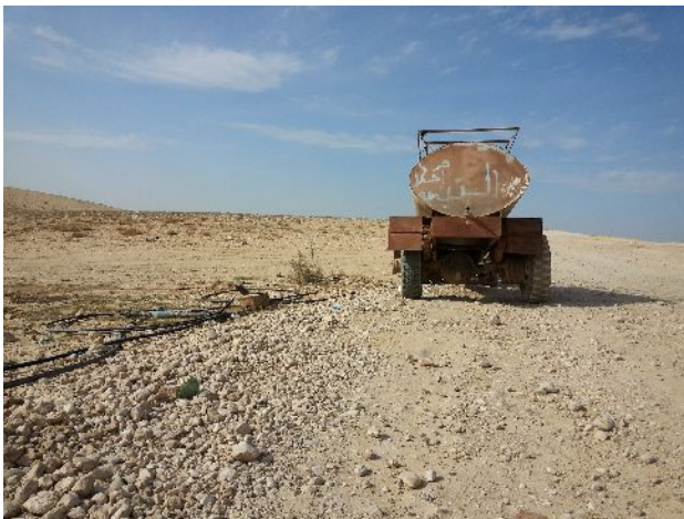
מיכלית מים בכפר הבלתי מוכר, סואוין. בשלוש עשרה שנים לפעילותה, רק כ-15.7% מהבקשות שהופנו לוועדת המים אושרו.

נימוקי הדחייה של ועדת המים היו כי לא ניתן לספק לכפר חיבור למים, בשל העובדה שהוא נמצא בסמיכות לשטח אש ועל אדמות מדינה. בנוסף לכך נטען כי קיים חיבור מים למשפחה המתגוררת בסמיכות לבית משפחתו של נ. בשל נימוקים אלו ולמרות העובדה שכ-90 אזרחים אינם מחוברים למים, טוענת הוועדה, כי לא קיימת בעיה של אספקת מים.