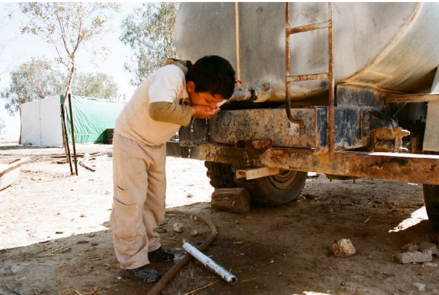
מיכלית מים בכפר הבלתי-מוכר, אל-עראקיב. בעיית חוסר הנגישות למים היא מהמרכזיות בבעיות הכפרים הבלתי-מוכרים.

בנוסף לתעריפים הללו, מערכות המים בכפרים הבלתי-מוכרים הן מערכות הנפרסות, מתוחזקות וממומנות על ידי התושבים. התושבים אחראים לפריסת תשתיות הצנרת וכן לתחזוקה שוטפת ולטיפול בביוב. בניגוד לשאר הצרכנים הביתיים שההוצאות הללו נכללות בחשבון המים שלהם, התשלום על התשתית בכפרים הבלתי-מוכרים הוא בנוסף לתעריף המים, הגבוה ממילא. מכאן עולה כי תעריף המים אינו רק גבוה במיוחד, אלא גם אינו מוצדק.