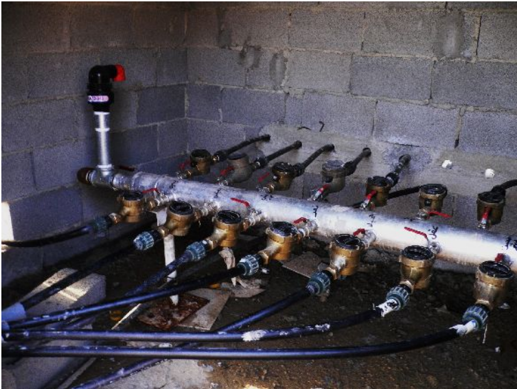
מערכת המים הפרטית בכפר אל-ג'רה. תושבי כפרים בלתי-מוכרים רבים מתלוננים על הפרשים גבוהים בין מונה המים של מקורות לשעון המים הפרטי.

להתמודד עם אי סדרים בתשלום ומשפחות שאינן עומדות בגובה התשלום. "כדי לאסוף את הכסף צריך להיות אדם חזק" מספר מ., "אם לא משלמים את הכסף, אני עצמי מלווה את הסכום החסר כדי לעמוד בתשלום ולא פעם נאלצתי אפילו לסגור את ברז המים. כשזה מגיע למים אני מתפקד כשוטר, שופט, מנהל חשבונות ואיש תחזוקה. אני משקיע בזה ימים שלמים בכל חודש".