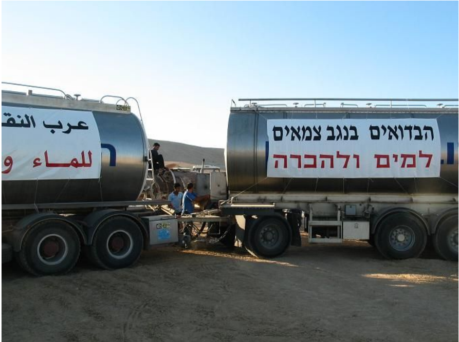
שיירת מים לכפר תל-עראד. המדינות מחויבות באספקת מים לכל האוכלוסייה כולל האוכלוסיות הפגיעות ביותר.

ההתפתחות בהכרה בזכות למים כזכות אדם, שהתרחשה בעשור האחרון, לוותה בפעילות ציבורית עניפה ואינטנסיבית של ארגונים לא-ממשלתיים