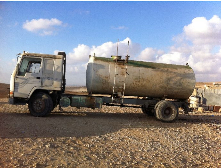
הובלת מים הכפר הבלתי מוכר סואוויין. המים המסופקים בדרך זו הינם ברמה סניטרית נמוכה ובמחיר גבוה.

כאמור, הובלת המים במיכליות כרוכה בהוצאות רבות: השכרת או רכישת רכב המתאים להובלת מיכליות, הוצאות הנסיעה, עלות זמן העבודה האבוד או שכירת פועל שיעשה זאת. כל אלו גורמים להאמרת מחיר המים עד לעשרות שקלים לקו"ב. מחיר זה גבוה כמובן באופן משמעותי מכל צרכן ביתי אחר בישראל.