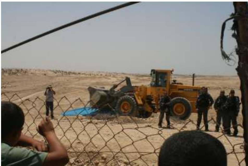
הכפר אל-עראקיב, ההריסה ה-25, יולי 2011

פורום דו-קיום בנגב לשוויון אזרחי | ת.ד. 130 עומר, 84965 | פלאפון: 0507701118-9