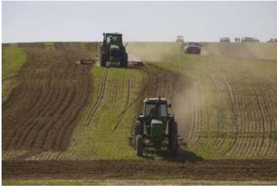
תמונה 3: חריש על ידי נציגי מנהל מקרקעי ישראל באל-עראקיב 10 לפברואר 2010