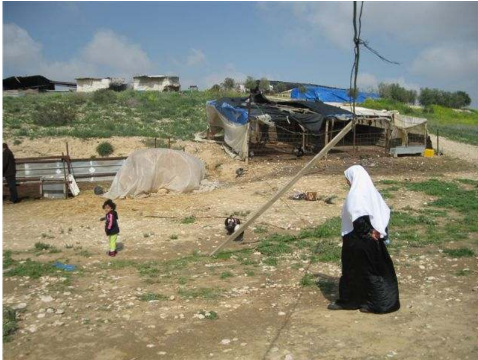
הכפר אל-עראקיב טרם ההריסה אביב 2010