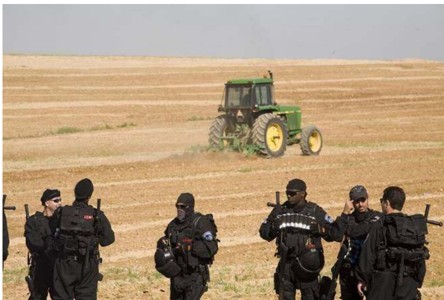
תמונה 4: כוחות מתפ"א באל-עראקיב בעת החריש של שדות עתה נבטו, 10 לפברואר 2010