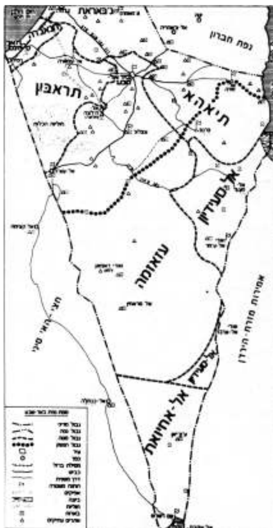
איור 1: תפרושת השבטים במרחב הנגב - לפני 1948 (מקור: עארף אל-עארף 1934)

בשנת 1948, ערב הקמת מדינת ישראל חיו במרחב הנגב-נקב כ-95,000 בדואים (ראו איור 1). אחרי המלחמה, שבמהלכה גורשו חלק מן הבדואים, נמשך גירושם מדרום הארץ. במפקד משנת 1960 נמצא, כי בנגב נותרו 11,000 בדואים. בתחילת שנות החמישים ריכזה מדינת ישראל את הבדואים באזור הסייג, אזור ביטחון סגור הנתון לממשל צבאי, שכניסה אליו ויציאה ממנו דרשה אישורים מיוחדים (ראו איור 2). מספר שבטים הועברו באותה תקופה מאדמותיהם בנגב המערבי והדרומי אל אזור הסייג. המדינה הכריזה על חלק גדול מאזור הסייג כאזור גלילי, דהיינו: אזור ללא כל שלטון מוניציפלי. חוק התכנון והבניה שנחקק בשנת 1965 הכריז על מרבית הקרקעות באזור הסייג כקרקעות חקלאיות, ולכן אסור היה לבנות בהן.