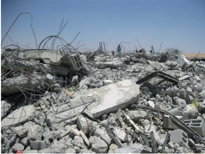
תמונה 1: הריסת בתים באל-פורעה, מאי 2011