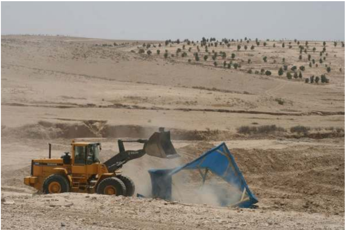
תמונה 2: הריסה באל-עראקיב, 25 לאוגוסט 2011