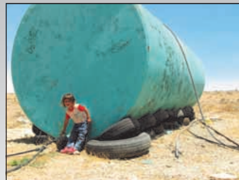
מיכל אחסון למים בכפר הבלתי מוכר אום אל חירן.

מתוך הערה כללית 15 של האו"ם הזכות למים (ד): " להבטיח ביטחון ללא כל כיום, בעת הגישה למים."