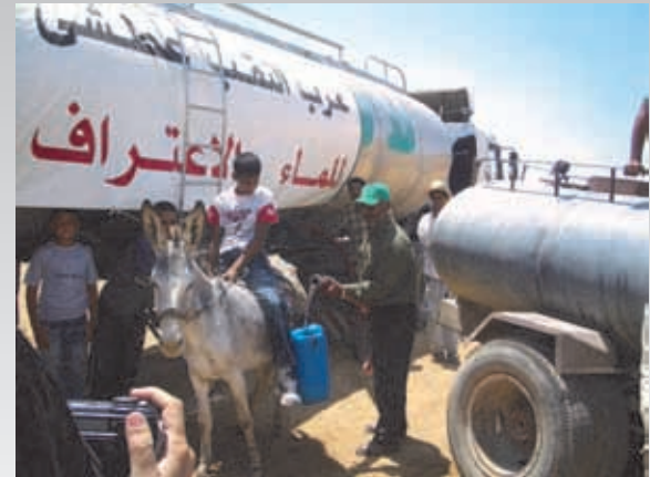
חלוקת מים בתל ערד 2005

אתר וינצפי: "מעל למיליארד בני אדם אין עדיין גישה למים נקיים" Over 1.1 billion people still do not have "Unicef Site: "access to safe water".