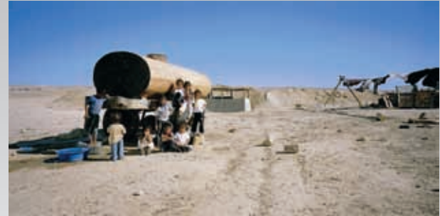
ילדים ממשפחת אלזורגן ומיכל מים בכפר הלא מוכר אלמזרעה

הועידה הבין-לאומית של האומות המאוחדות לאוכלוסייה ופיתוח, 1994 אישרה כי לכל בני האדם: "הזכות לרמת חיים הולמת לעצמם ולמשפחותיהם, ובכלל זאת הזכות למזון, ביגוד, דיור, מים ותברואה הולמים".