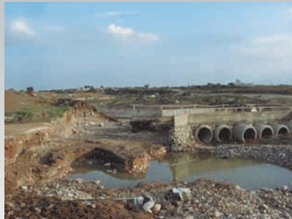
גשר שבנו תושבי הכפר אום-בטין המחבר את שני חלקי הכפר, התמוטט ונשטף במי נחל חברון

מן כולל המלחצה העמיה רעם 15 הלהבחה ללמם המהדה, בנד חק המיהה (א): "זמן הצולול עליו אף כמיהה זרוריהה מן המיהה הלהי תקפיה ללסלסדמיו השחשי והמנזלי והדה מן הלסלסדמיו המרעז".