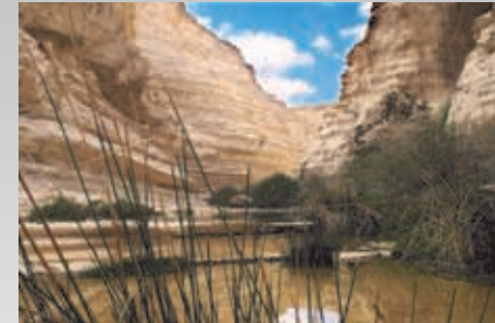
עין עבדת

אתר הבנק העולמי: "220 מיליון תושבי הערים בעולם המתפתח, הם חסרי גישה למקור מי שתיה הולמים בקרבת בתיהם".