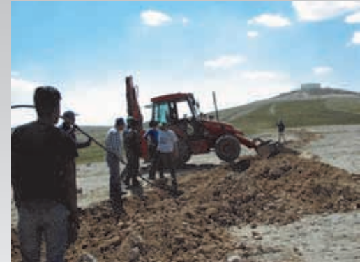
חברי פורום "הכרה" מניחים צינור מים לכפר הבלתי מוכר קטמט 2004

תסריח מאר – דל – פלאטה التابع لسلطة المياه التابعة للأمم المتحدة من عام 1977 – يقرر بأن: " لكل الشعوب - بغض النظر عن مستوي تطورها ومستواها الاجتماعي والإقتصادي - الحق الحصول على مياه الشرب بالكميات والجودة التي تتناسب واحتياجاتها الأساسية".